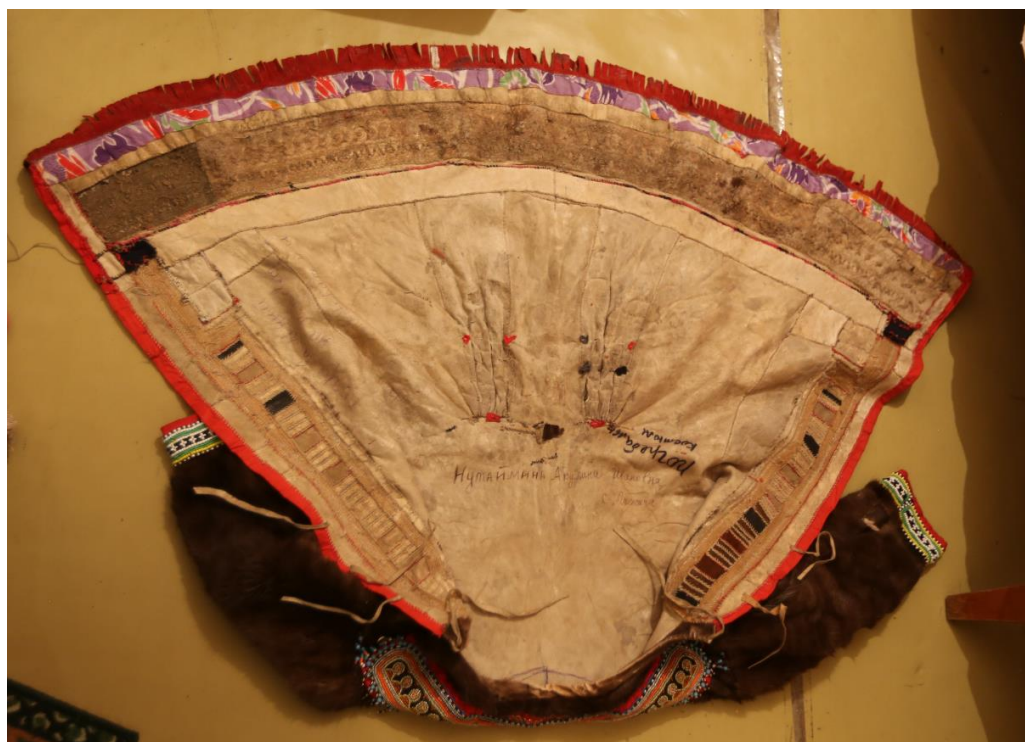
Эвенская традиционная верхняя одежда – кукыйды . Часть комплекта погребальной одежды, сшитой для себя ныне здравствующей Акулиной Ивановной Нутайминой из с. Гижига, проживающей в п. Эвенск. Фотография процесса сканирования