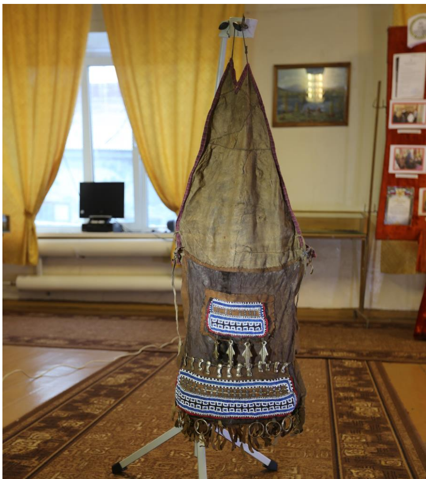
Эвенский женский фартук – нэл . Ровдуга, бисер, украшения из бронзовых литых фигур и колец. Фотография процесса сканирования