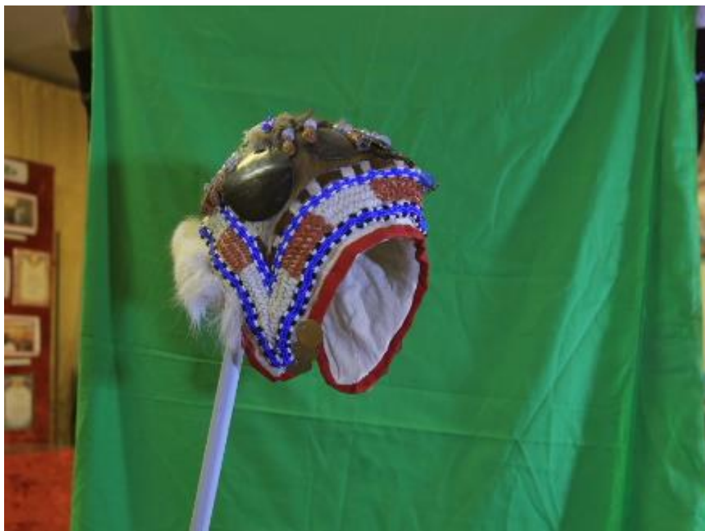
Эвенский женский головной убор – нечэлми . Ровдуга, белый и окрашенный ольхой подшейный волос оленя, мех собаки, ткань, бисер, металл, набор бус