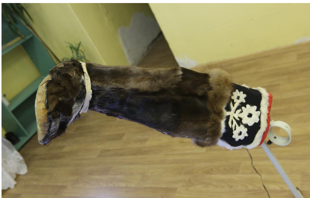
Эвенские традиционные длинные унты – нугду . Мастер Бакова Христина Ивановна (с. Гижига). Олений камус, шкура нерпы для подошвы, опушка из меха соболя, меховая аппликация, ровдуга, ткань. Фотография процесса сканирования