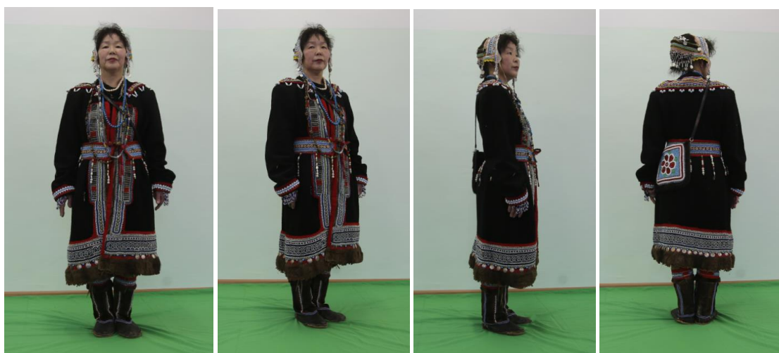
Некоторые из участниц эвенского народного ансамбля «Нгерин» из с. Гижига в собственных традиционных костюмах