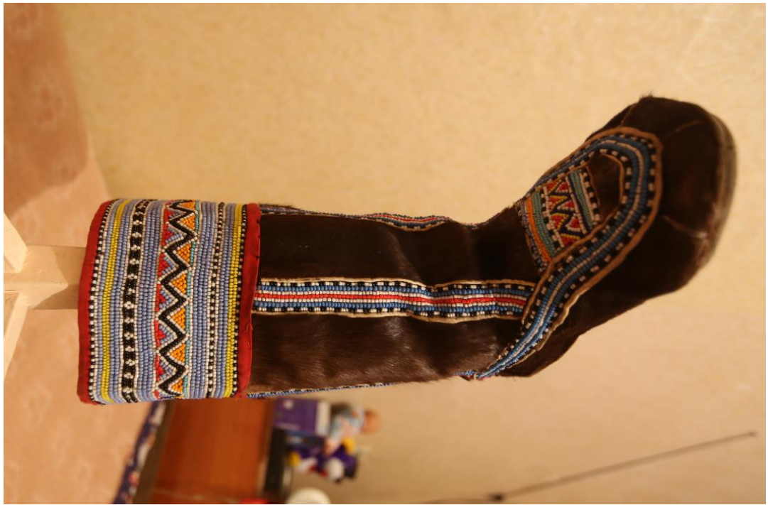
Эвенские традиционные женские унты с бисером – нисами . Мастер Нутаймина Акулина Ивановна (с. Гижига). Олений камус, шкура нерпы для подошвы, ткань, вышивка бисером. Фотография процесса сканирования