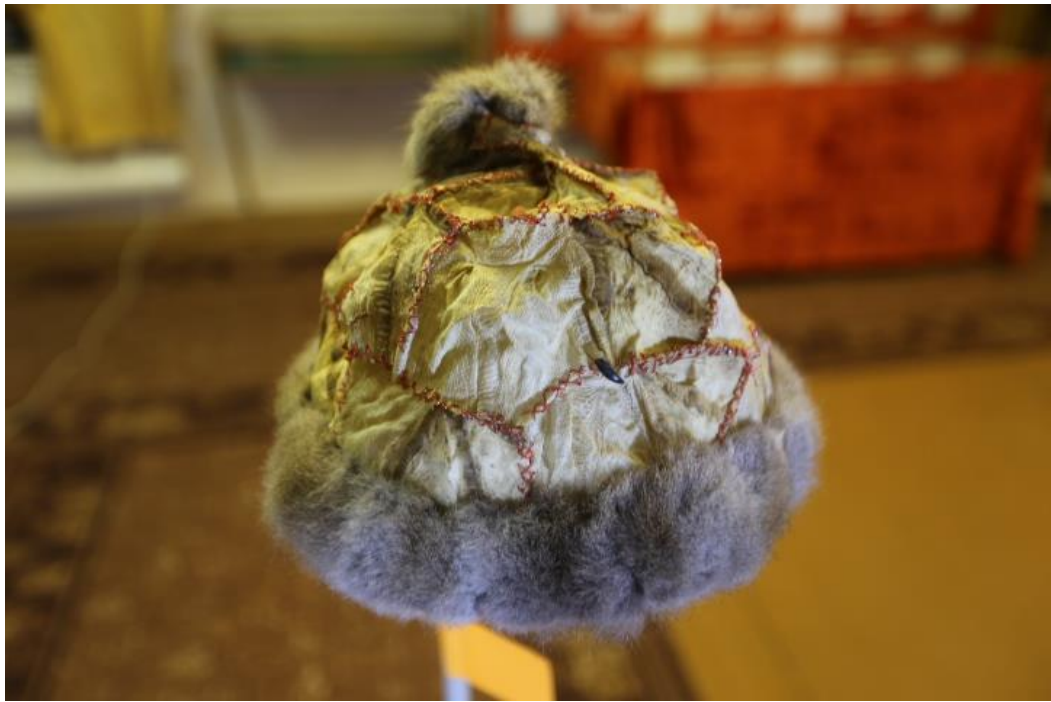
Корякская шапка из выделанных лапок гуся, опушка из беличьего меха (мастер Н.Н. Хай-Хутык)