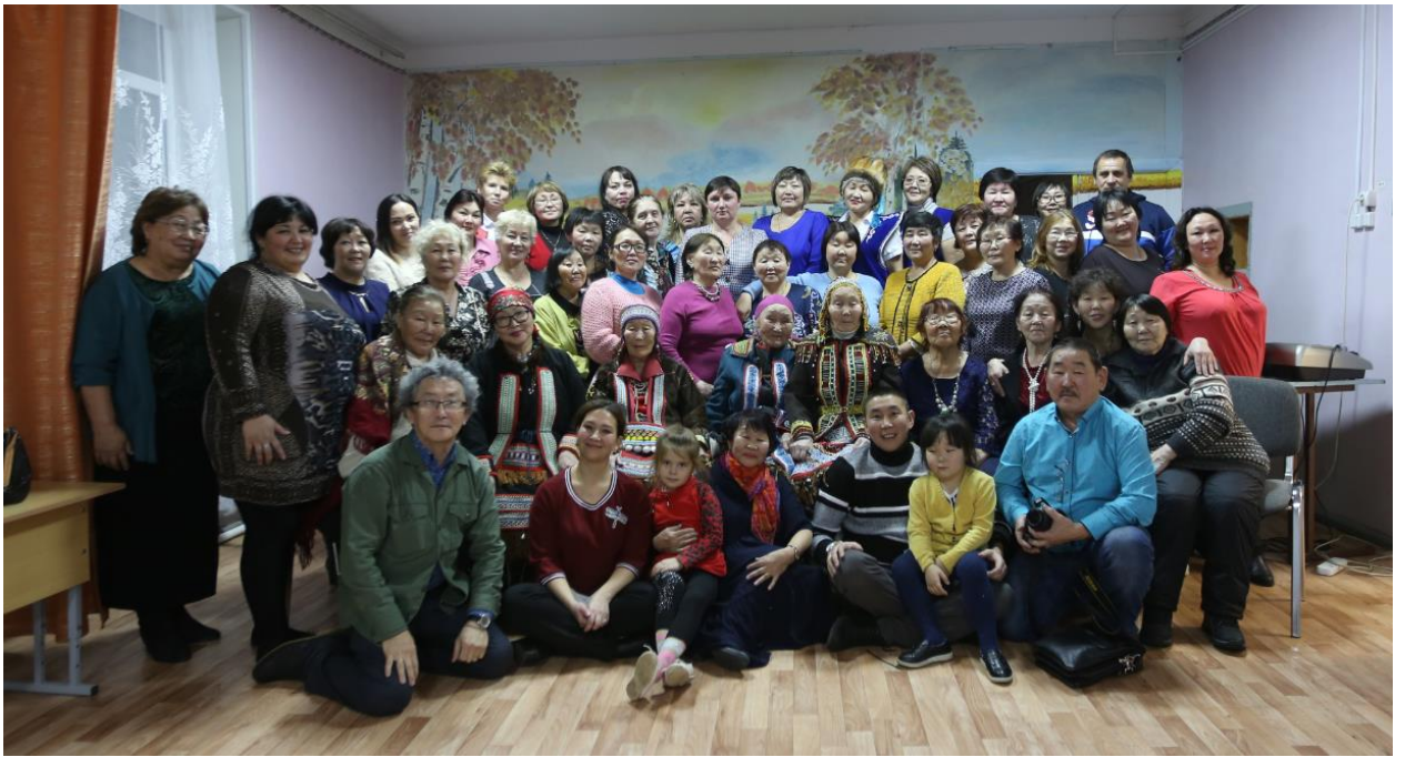
Участники вечера национальных общин п. Эвенск в Центре детского творчества, особыми гостями которого был ансамбль «Нгерин» из с. Гижига