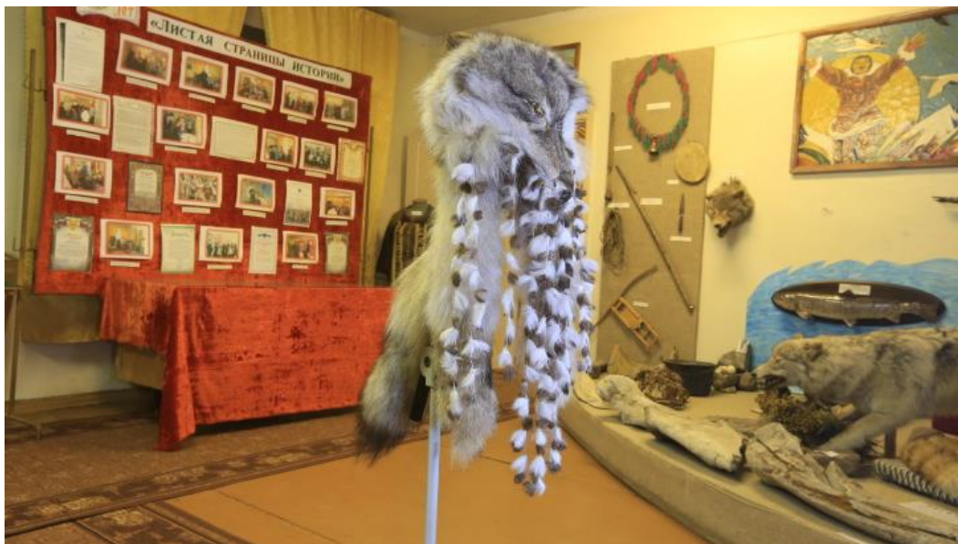
Корякская шаманская ритуальная шапка (мастер Н.Н. Хай-Хутык). Выделанная волчья шкура с головы, хвост, мех.