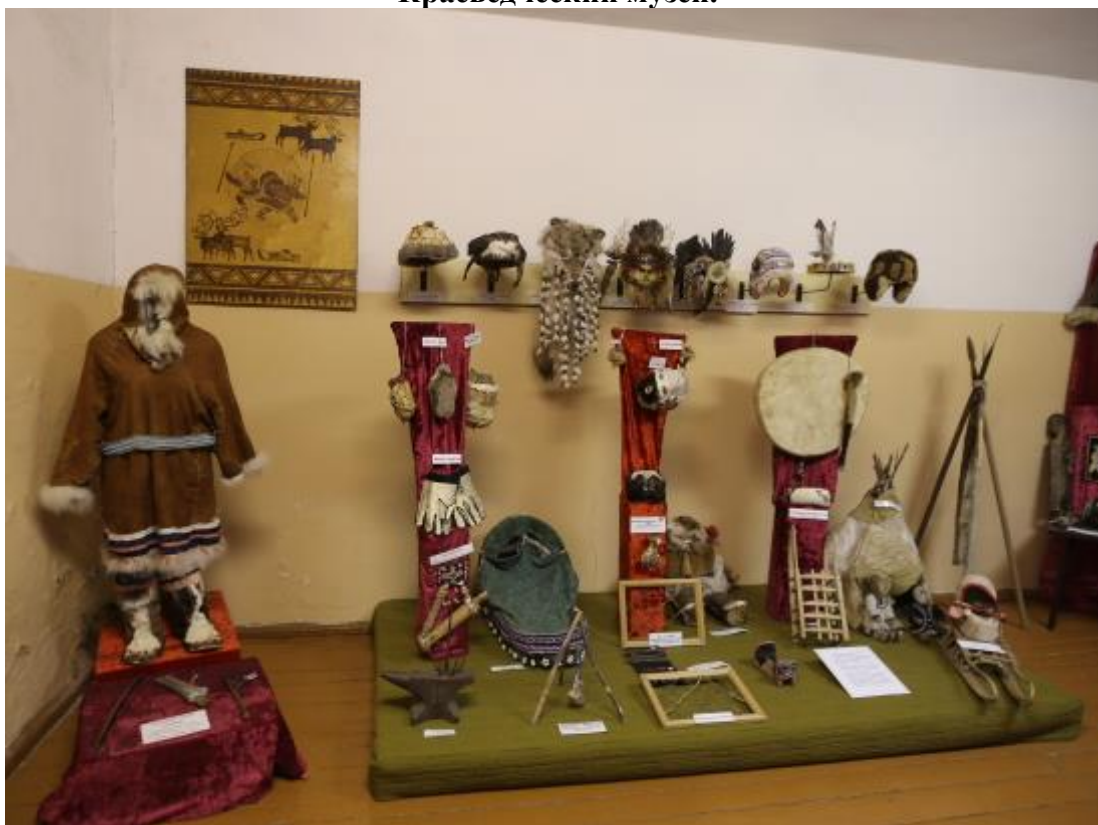
Образцы объектов традиционной культуры региона (из коллекции Северо-Эвенского краеведческого музея)