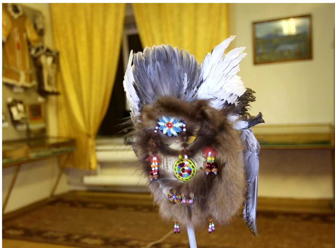
Эвенская маска в виде головного убора для воспитательного устрашения детей (запрет детям приближаться к опасным местам). Оперение крохали, ровдуга, соболь, бисер, фетр