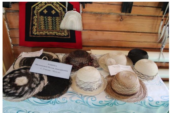
Олекминский район, с. Улахан-Мунгку работы народных мастеров и умельцев с. Улахан-Мунгку