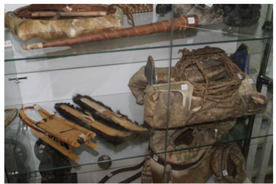
Олекминский район, Тянский национальный наслег Экспонаты Тянского пришкольного музея