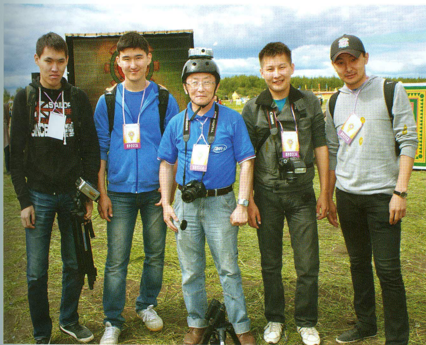
Съемочная группа Информационной системы "Олонхо". Республиканский Ысыах Олонхо. 2012, г. Нюрба.